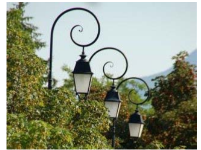
Certains luminaires équipant la place du village ont été déconnectés

Cette première approche a permis d'identifier, sur la place du village, les luminaires superflus, contribuant au sur-éclairage.